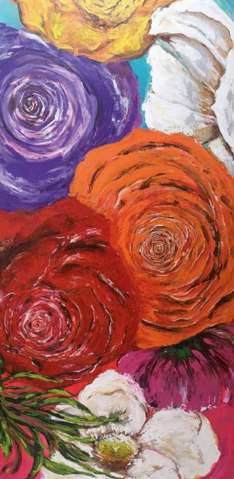
Da série que fim levaram todas as flores 2mt x 1mt acrílica sobre tela 2020