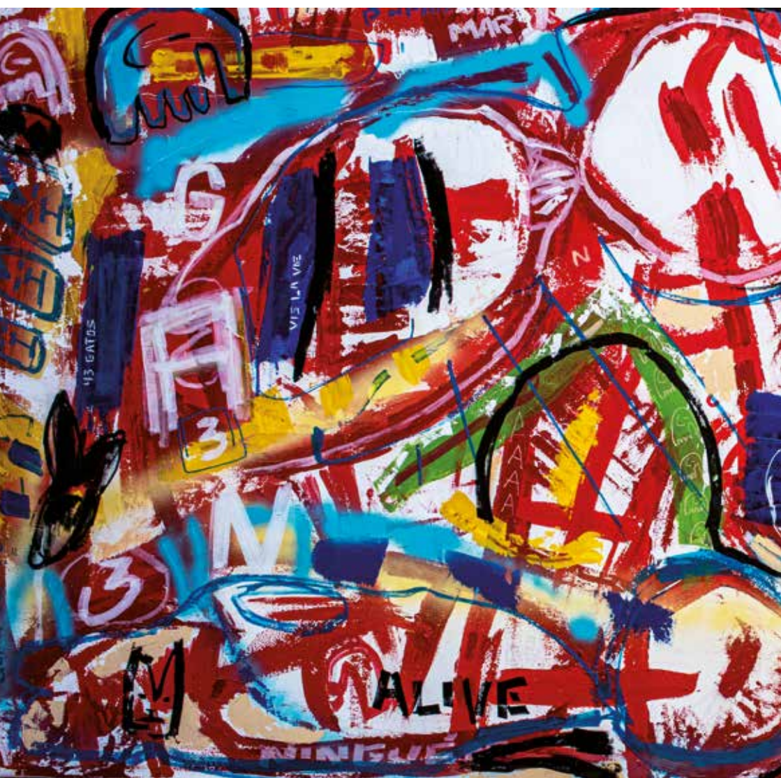
Alive acrílica e marcador sobre tela 2,50mt X 1,20mt 2020